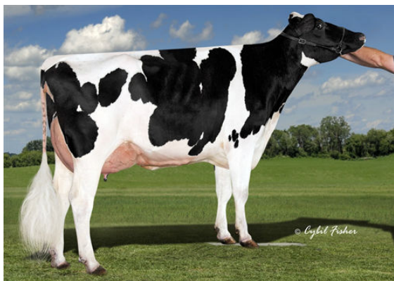
COOKIECUTTER SUPR HAZAJÓ DAM