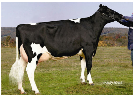
COOKIECUTTER GLD HOLLER FIFTH DAM